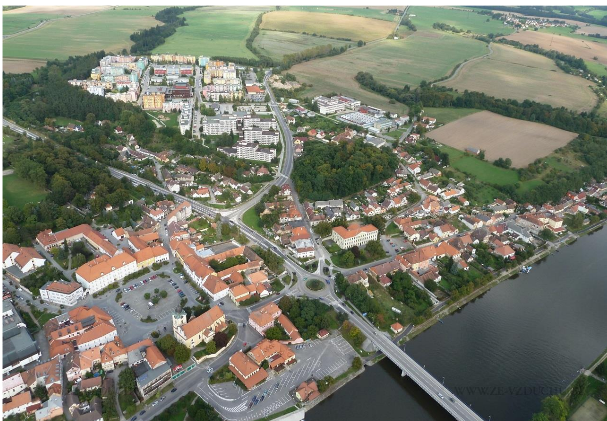
Pohled na sídliště Hlinky a jeho návaznost na centrum města, stav v roce 2012.

Dle závěrů ankety mezi obyvateli z roku 2019 Hlineckému sídlišti chybí příjemná veřejná prostranství jako jsou funkční náměstí, upravené předprostory paneláků, aktivní a kultivované partery, místa pro aktivní trávení volného času dětí i dospělých a s tím související osvětlení, zeleň, městský mobiliář atd. (více viz https://tynnadvltavou-mestoprozivot.cz/ ). Není promyšlena návaznost na centrum města pro pěší (podél ul. Veselská), ani provázání s okolními lokalitami. Chybí tu také služby, občanská vybavenost, kavárny, restaurace i bankomat. Sídliště je v některých částech hlučné, špinavé, lidé se zde necítí bezpečně.