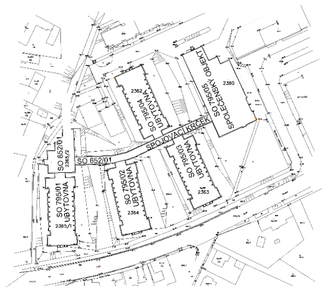
AREÁL BLANICE, TÝN NAD VLTAVOU- SITUACE OBJEKTŮ

Areál tvoří neprostupnou bariéru mezi sídlištěm Hlinky a centrem města. Působí jako neadekvátní dominanta.